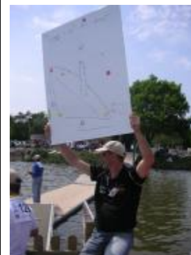
Pour étalonnage du format